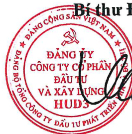
Vương Đăng Phương